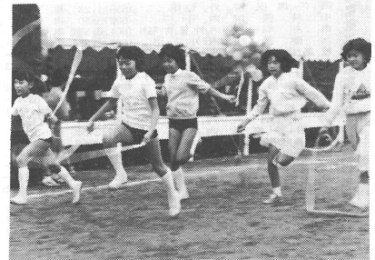
よいい、ドン。めざすはゴール(7日、区民大運動会)