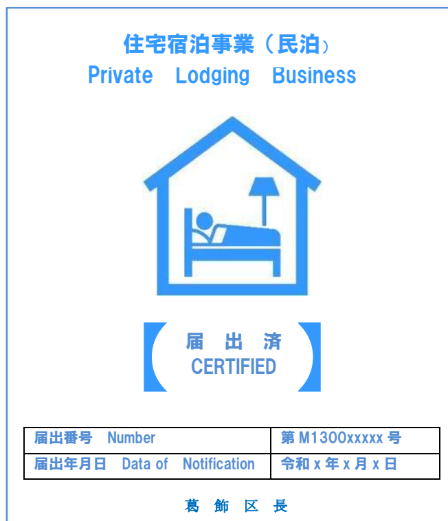
法令で定められた標識（見本）