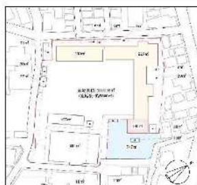
▲現在の敷地配置図（旧小谷野小学校）