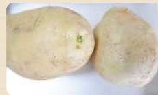
芽が出たじゃがいも(左) 緑化したじゃがいも(右)

じゃがいもは皮つきで食べることが珍しくはない食材ですが、芽やその周辺には毒素が多く含まれているので取り除かなくてはなりません。近年、じゃがいもによる食中毒事例が報告されています。じゃがいもは、光に当たると緑色に変色することがあります。緑色に変色した箇所には芽と同じ毒素が含まれているので、確実に取り除いて調理するようにしましょう。