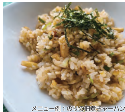
メニュー例：のりの佃煮チャーハン