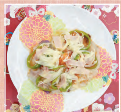
もちピザトースト