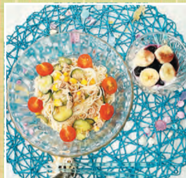
夏やさいとぴったり!かんたん おいしいツナマヨそうめん