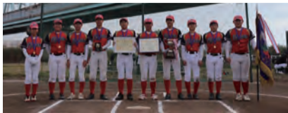
▲小松フェニックスA