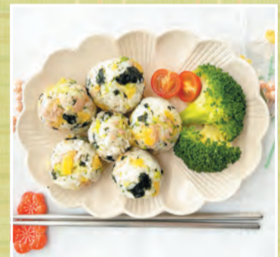
韓国風一口おにぎり