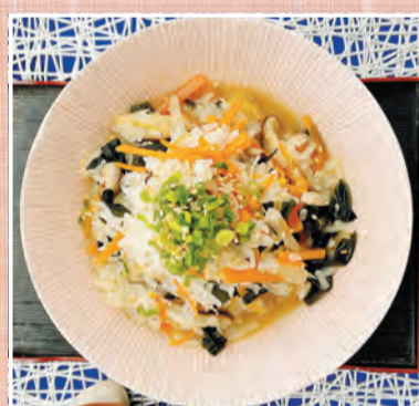
まごわやさし! 栄養満点ぞうすい