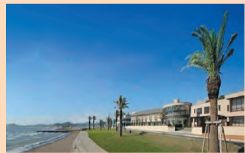
▲館山シーサイドホテル