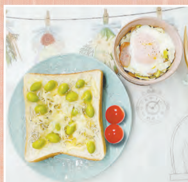
枝豆とじゃこのチーズトースト・ キャベツとソーセージのココットエッグ