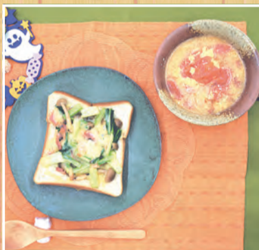
こまつなソテートーストと トマトスープ