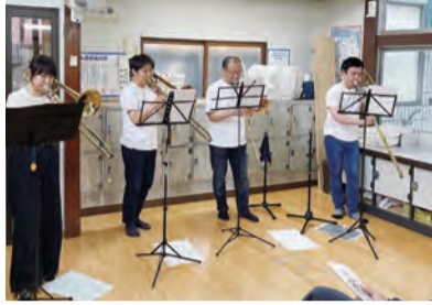
▲音楽イベントの様子