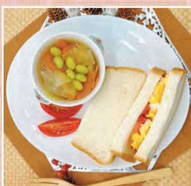
食感が楽しい スーププレート