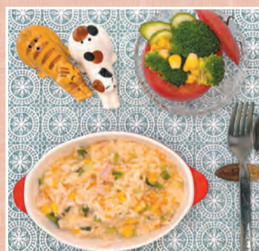
トマトカップサラダと トマトドリア風