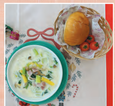
具たくさんクリームスープ