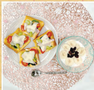
カラフル! たいようフレンチトーストと フルーツハニーヨーグルト