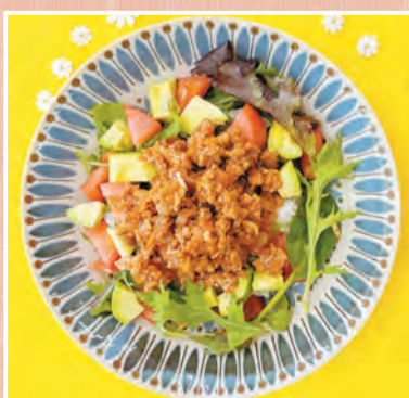
とまとたっぷりひき肉ごはん