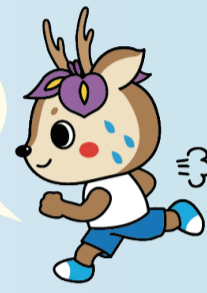
大会公式マスコット「ラン丸」

エントリーした方限定! ゲストランナーによる RUNフェスタ対策教室も 開催します!!