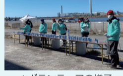
▲ボランティアの様子