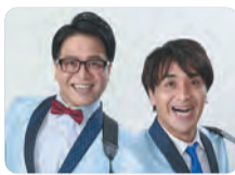
▲シマッシュレコードさん