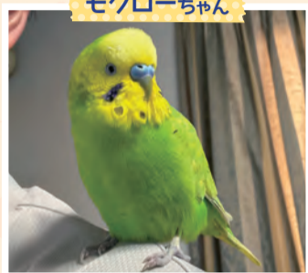
うちに来てくれてありがとう