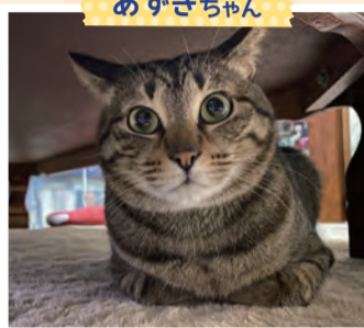
モフモフの前足がかわいい