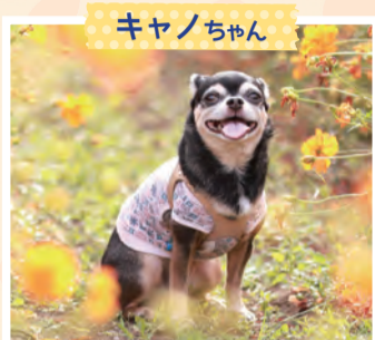
いつものお散歩コースで季節の1枚