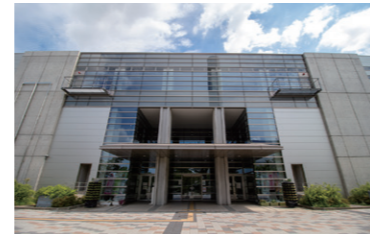
◀トレーニングルーム

【主な施設】メイン・サブアリーナ(体育館)、トレーニングルーム、温水プール、テニスコート