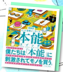
『本能スイッチ』 博報堂ヒット習慣メーカーズ編 (イースト・プレス刊)

★関連資料展示★ メインカウンター前にて展示を行います。 中央図書館の関連書架:56(マーケティング) 1~3(ビジネスコーナー)このポスターが目印です。