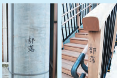
区内で発見された差別落書き

また、区内では、平成13年以来同和問題に関する差別落書きが断続的に発生しています。差別落書きは当事者の心を深く傷つける行為であり、新たな差別行為へとつながりかねません。差別落書きを発見した場合は、人権推進課 (☎03-5654-8148) までご連絡ください。