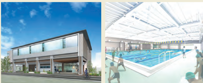
(仮称) 新宿地区屋内温水プールイメージ図