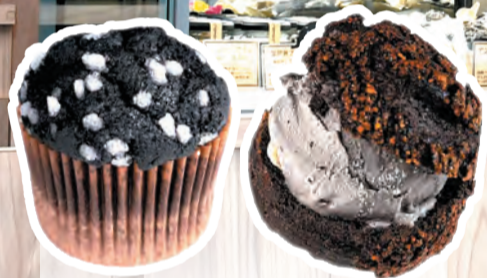
(左) パナナマフィン (右) アイスシュークリーム黒胡麻