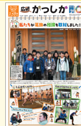
▲昨年度の子ども広報