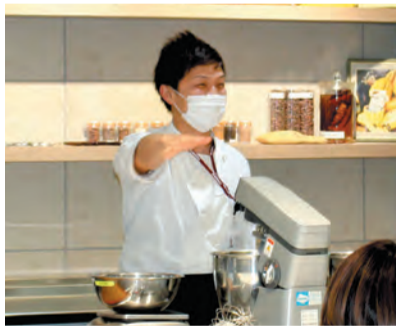
▲食品メーカーで働いていた当時の様子

高校卒業後、日本やフランスのパティスリーで修行を積んだ後、大手食品メーカーに就職して、レシピ開発や企画・提案を行って来ました。黒いお菓子と出会ったのは、12年程前に食品メーカーでレシピ開発をしていた時のこと。当時、コンビニで黒いお菓子がはやっていて、その原料の一つがブラックココアでした。ブラックココアは、そのままだとおいしくないのですが、この難しい食材を使ってレシピ作り挑戦することやお菓子を黒く染めることが楽しくて、黒いお菓子作りへのめり込みました。そして、全国の企業へ商品の企画・提案を行う中で、いつか自分のお店を開くという夢を今なら叶えられるかと思えるようになった。黒いお菓子を並べたお店を開くことを決意しました。