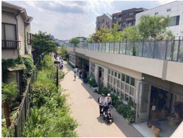
下北沢駅などからの 遊歩道として整備された 全長約1.7kmの線路跡地