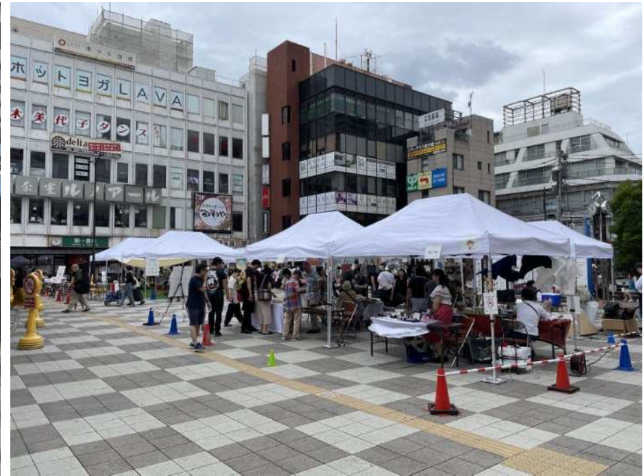
北口駅前広場での様子（雑貨・ハンドメイド） （令和5年7月15日撮影）