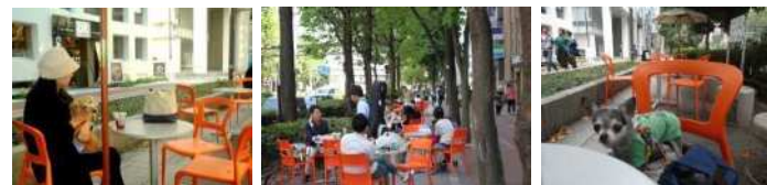
ペットと共存した街路空間 (池袋駅東口グリーン大通りでの オープンカフェ社会実験)