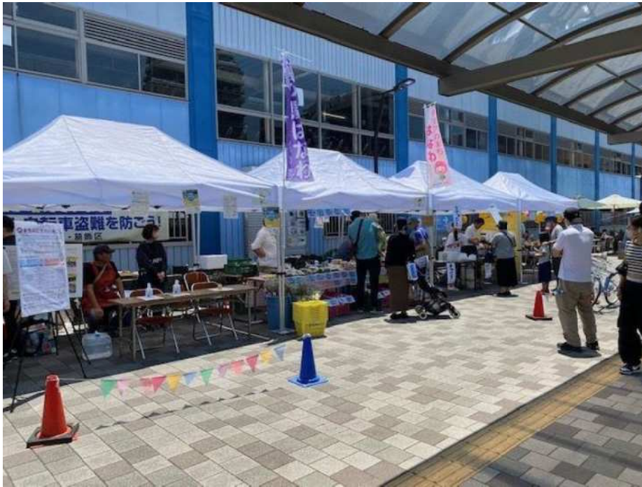
東北広場での様子（飲食ブース） （令和5年6月17日撮影）

新小岩北地域まちづくり協議会がエリアマネジメントの社会実験として北口駅前広場と東北広場で実施しました。（「あそびば」プロジェクト）