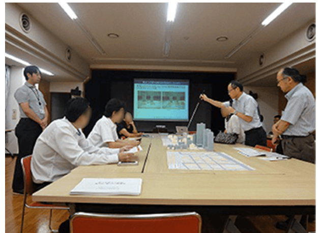
《写真：勉強会の様子》