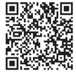
▲ Google form