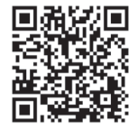
▲ かつしかく 葛飾区 ホームページ