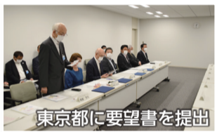
東京都に要望書を提出