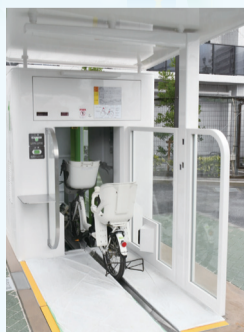
▲ 自転車を収納する様子

学生や身体障害者手帳をお持ちの方など、利用料の減額を受けられる場合があります。詳しくはお問い合わせください。