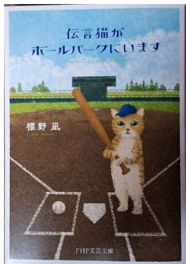
標野 凧(著) PHP 文芸文庫

メッセージ…私の小説では「人」ではないものが語り手となることがしばしばあります。人以外のものに語らせることによって、話が膨らんだり視点が変わったり、と、さまざまな効果をもたらします。 私なりの本の作り方や小説を書くようになったきっかけなどもお話ししたいと思います。