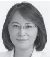
副議長 山本 ひろみ (令和3年11月16日就任)