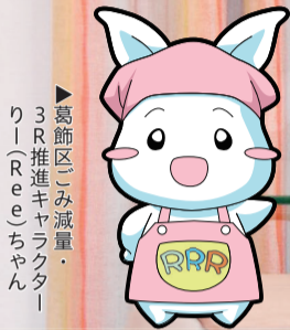
葛飾区ごみ減量・ 3R推進キャラクター りー(Ree)ちゃん