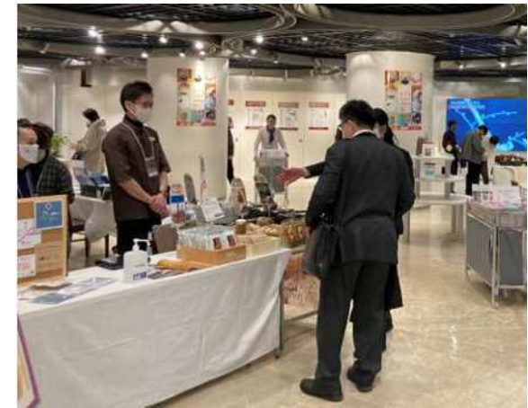
(区外販売会〔KITTE〕の様子)