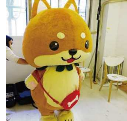
(R2認定の“エア着ぐるみ”)