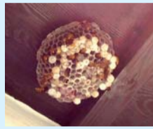
アシナガバチの巣

たりしなければハチから刺してこられることはほとんどありません。家の軒下やベランダに10cmくらいの傘状で穴がたくさん開いている巣を作ります。