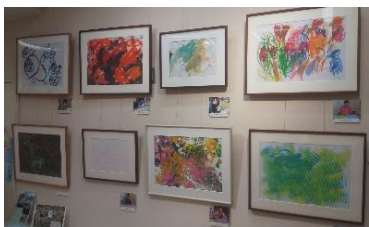
①アール・ブリュットなどの作品展示 (創造性のある取組)