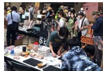
③多数の福祉団体が参加 (関連分野との連携を図る取組)