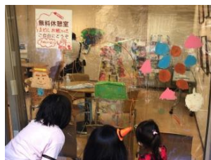
②子どもも楽しめるアートワークショップ (将来の文化創造に資する取組)