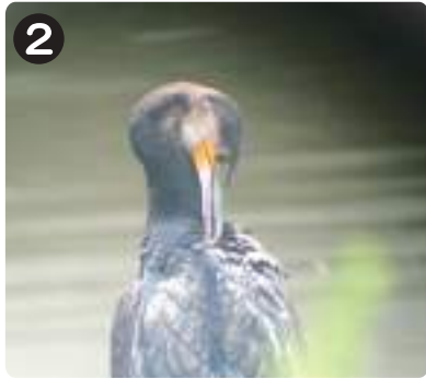
2 7/7カワウ 羽繕いをしてから、翼を大きく広げて体全体を乾かしている様子が水元かわせみの里でよく見られる。