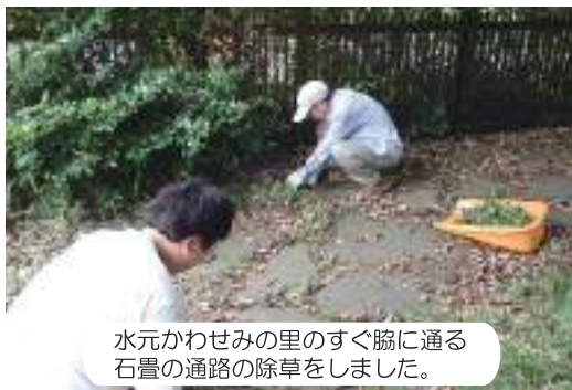
水元かわせみの里のすぐ脇に通る石畳の通路の除草をしました。

7月11日に水元かわせみの里周辺の除草活動を行いました。来園者の皆さまに水元かわせみの里を利用してもらいやすくするため、通り道となる環境を整備しました。水元かわせみの里は様々な生きものが見られるので、全ての植物を除草せず、調整しながら活動します。