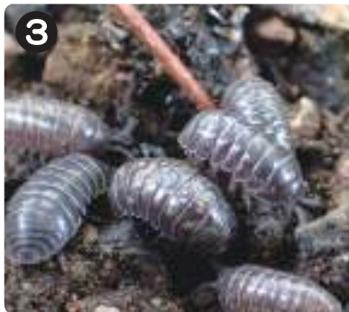
3 7/7オカダンゴムシ 湿り気のある木の割れ目や土の上で集団になり、生きもの死骸を食べていた。