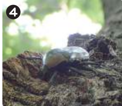
4 7/7カナブン 水元かわせみの里近くのクヌギの木で見られた。頭をうずめて樹液を食べていた。