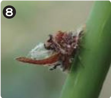
8 7/7クサカゲロウの中間の幼虫 肉食でアブラムシなどを捕えて食べる。木くずや葉片を背負って擬態していた。