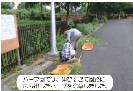
ハーブ園では、伸びすぎて園路にはみ出したハーブを除草しました。