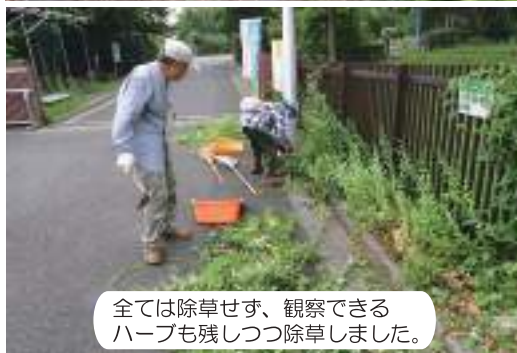
全ては除草せず、観察できるハーブも残しつつ除草しました。