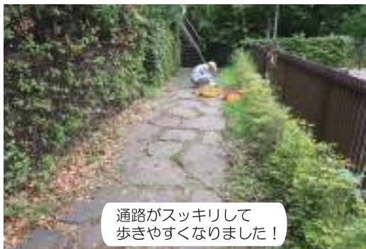
通路がスッキリして歩きやすくなりました！