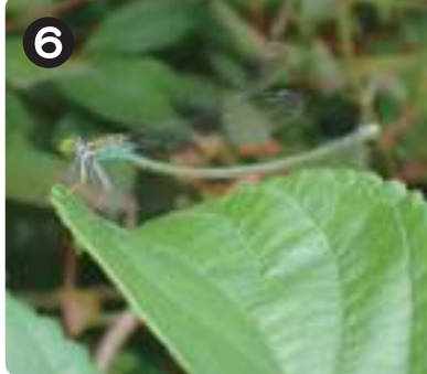
6 7/7クロイトトンボ 日が当たる葉の上に止まっていた。暑さをしのぐためか、腹部を上げていた。