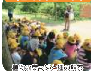
植物の葉っぱと種の観察

水元小合溜周辺の身近な生きものや、環境、歴史について楽しく学びます。水質浄化センターの見学なども可能です。