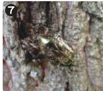
7 7/7シロテンハナムグリ 羽音をたてながら木に飛んできた。樹液を求めて移動していたのかもしれない。