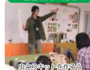
虫とのキットを作る

水辺の生きもの調査、図鑑作りなど、様々な内容の自由研究のイベントを行い、夏休みの児童への、学習のサポートをします。