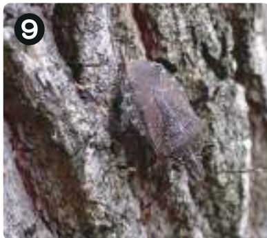
9 7/7キマダラカメムシ 身近で見られるカメムシで最大級。頭の近くを飛ばれると、その翅音の大きさに驚く。

2 ● 写真を撮った場所を地図上に示してありますが、他の場所でも見られます。皆さんもぜひ見つけてみましょう。