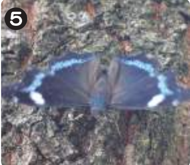
5 7/7アルリタテハ 木にとまって翅を開いて閉じて繰り返していた。翅の表面は青く、裏面の模様は樹皮によく似る。