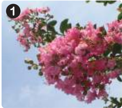
1 7/7サルスベリ 水元かわせみの里ふれあいルームからも見られる。「百日紅」とも呼ばれ、花は3カ月ほど見られる。