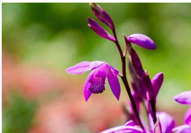
『白鳥4丁目公園にて』