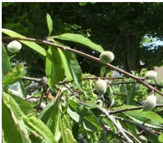
2022.04.02 『白鳥4丁目公園にて』 2022.05.03