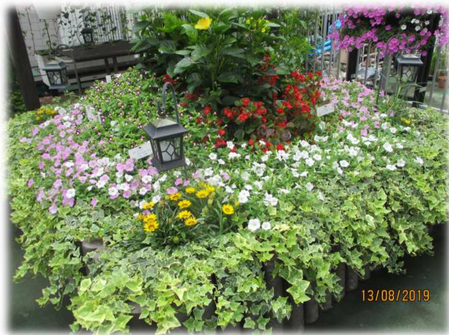
区役所 緑と花のいこいガーデンの花壇

今まで花壇で育てた中で育てやすい花は、アングロニア、ペンタス、ブルーサルビア、トレニア、ジニア、ベゴニア、ポーチウラカ、マリーゴールド、コリウス、ハツユキソウ。花がらつみも大事な作業ですが、私が参加している区役所内の緑と花のいこいガーデンで活動するガーデンプロジェクト12、金町駅南口で活動するフラワーキープの会、水元公園グリーンプラザ友の会で育てやすい花苗を紹介しました。追加で、ペチュニアのさくらさくらシリーズが夏一番元気ですね。