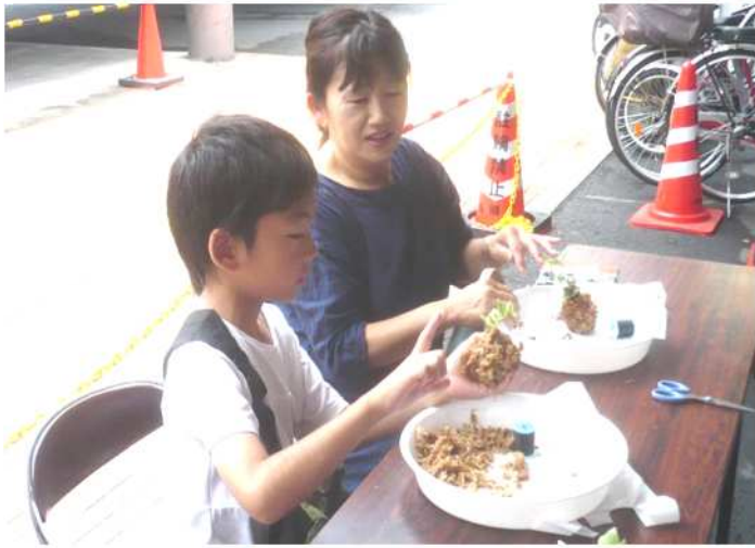
B-3 アイビーコケ玉制作と完成したコケ玉↑