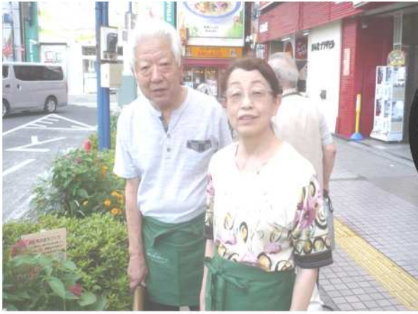
B-1 ガーデニングエプロン ↑