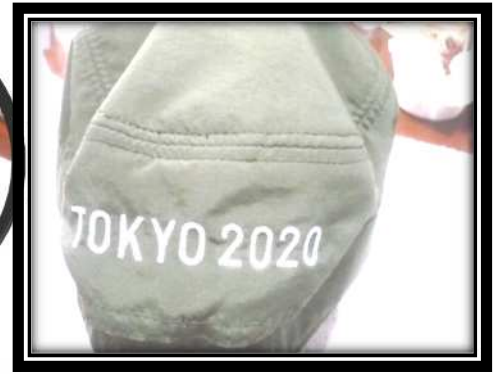
B-2 オリンピックマーク入りワークキャップ↑