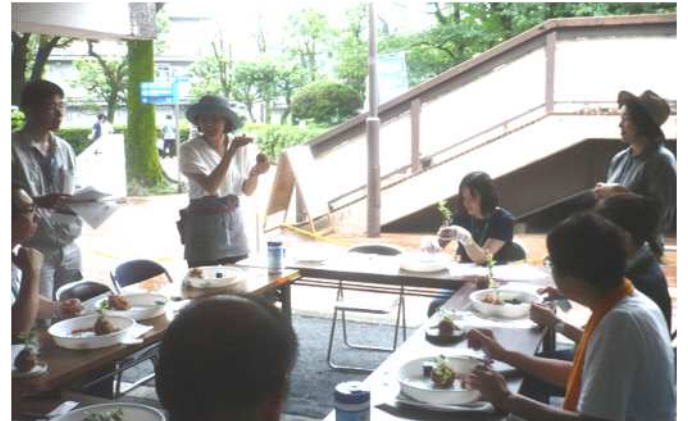
A-2 ミニ園芸教室担当の緑化推進協力員事前研修