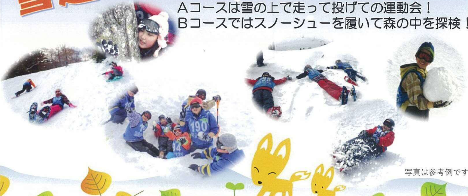
写真は参考例です

雪に覆われた真っ白な世界へ飛び出そう！ Aコースは雪の上で走って投げての運動会！ Bコースではスノーシューを履いて森の中を探検！