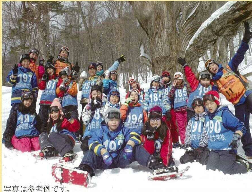
写真は参考例です。

葛飾区立日光林間学園は平成25年度よりNPO法人国際自然大学校が運営に参画し、年間を通してより充実した自然体験活動を提供しております。