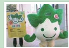
PR 用着ぐるみ「元気くん」