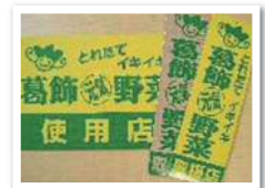
取扱店・使用店看板

葛飾区では、区民のみなさんに地場産の新鮮で安全な「旬の野菜」を食していただきたいと考えています。「葛飾元気野菜」の販路拡大と地域での消費拡大を目的として、登録店を募集します。葛飾産野菜を販売するお店を「取扱店」、葛飾元気野菜を使用した加工品を販売するお店、また、葛飾元気野菜を使用した料理を提供する飲食店を「使用店」として登録します。登録いただいた店舗には PR 用看板、のぼり旗等を差し上げます。着ぐるみ「元気くん」の貸出も行います。