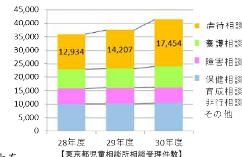
【東京都児童相談所相談受件数】