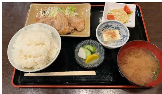
↑ 同行者が注文したもの

開店と同時に入店しましたが、店内はほぼ満席でした。ご飯を少なめと注文されている方が何組かいらっしゃいました。健康的な食のサービスを気軽に利用できる事が人気店の理由の一つにもあるのかなとふと感じました。