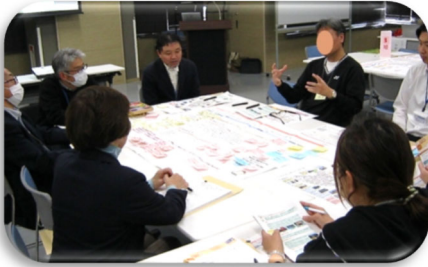
↑グループワークの様子