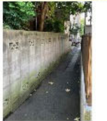
○高さがある ブロック塀 と細い路地