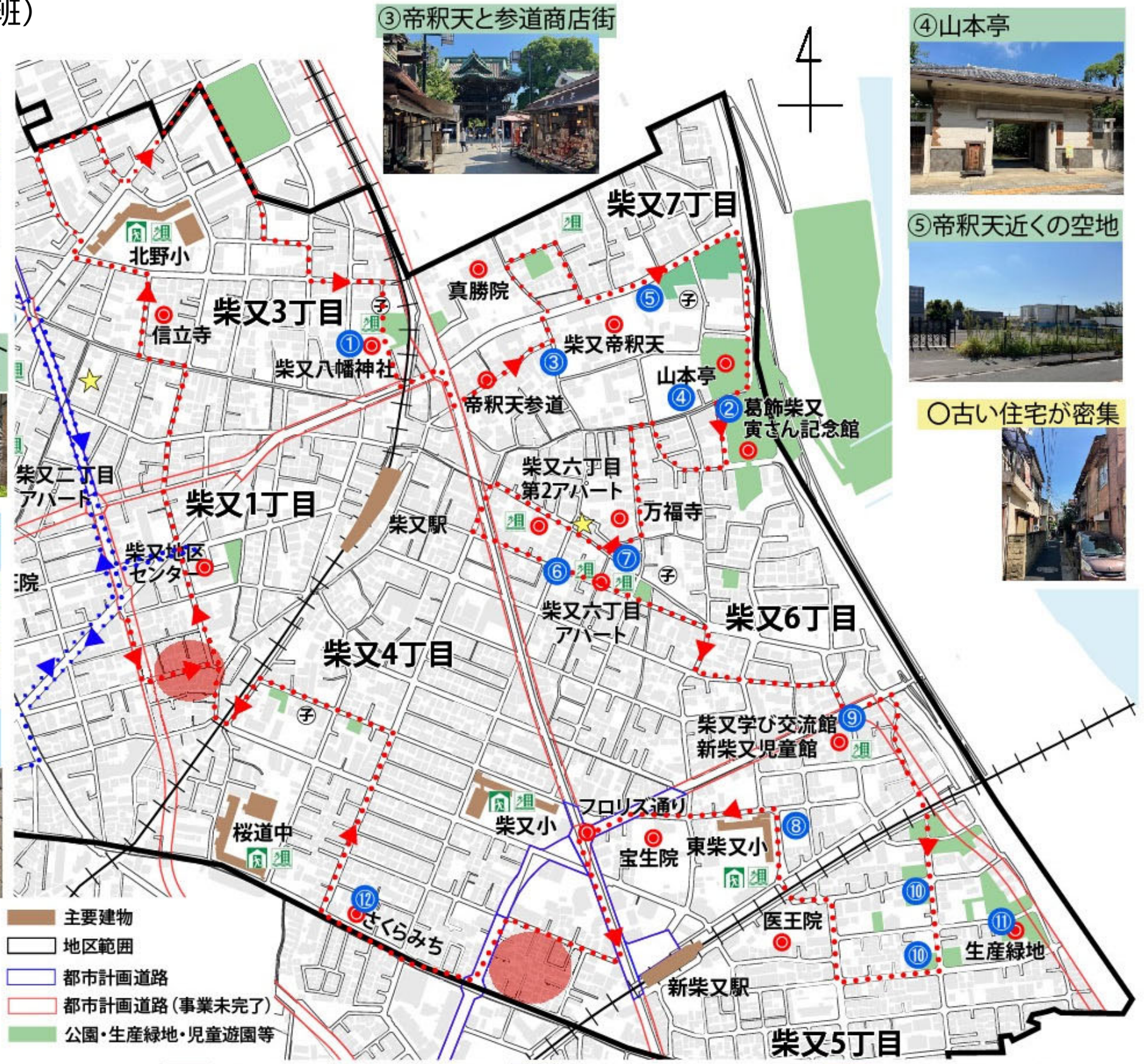
③帝釈天と参道商店街