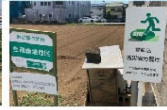
⑪防災協力農地 の生産緑地