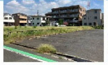
⑧東柴又小学校に 隣接する空地