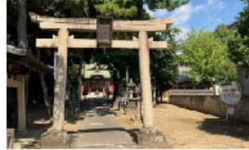
①柴又八幡神社 ・・一時避難場所