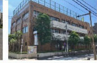
⑨柴又学び交流館 新柴又児童館