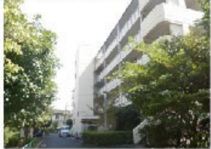
①洪水緊急避難場所 ・・都営アパート