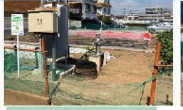
⑩防災兼用農業用 井戸がある生産緑地