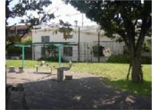
②柴又二丁目公園 ・・一時集合場所