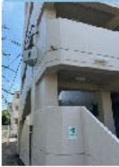
⑥洪水緊急避難場所 都営柴又6丁目 アパート