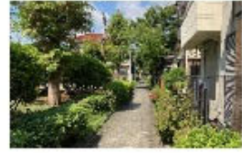
⑦都営アパート 北側の緑道