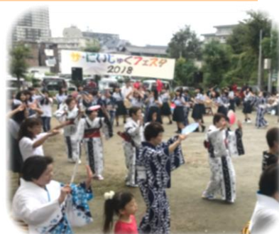
ザ・にいじゅくフェスタ 2018