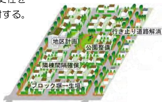
まちづくりのルールのもとでの復興イメージ