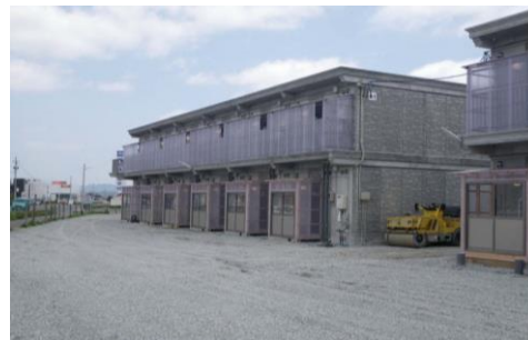
応急仮設住宅 2階建ての例