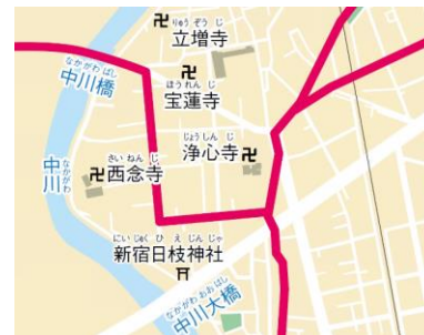
現在も残る直角に曲がる新宿の道