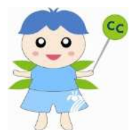
消費生活センター イメージキャラクター まもる 守くん