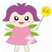
消費生活センター イメージキャラクター みらい 未来ちゃん