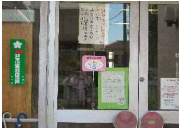
赤ちゃんの駅 ステッカー