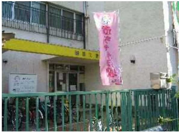
赤ちゃんの駅 のぼり旗