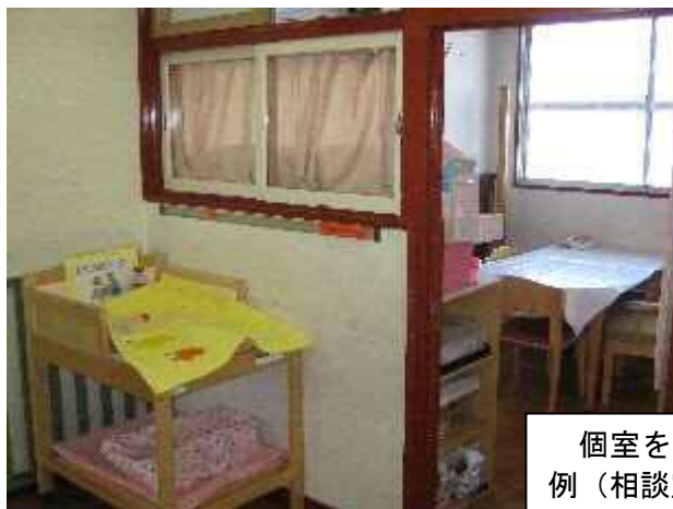
個室を兼用で使用している例（相談室と兼用）