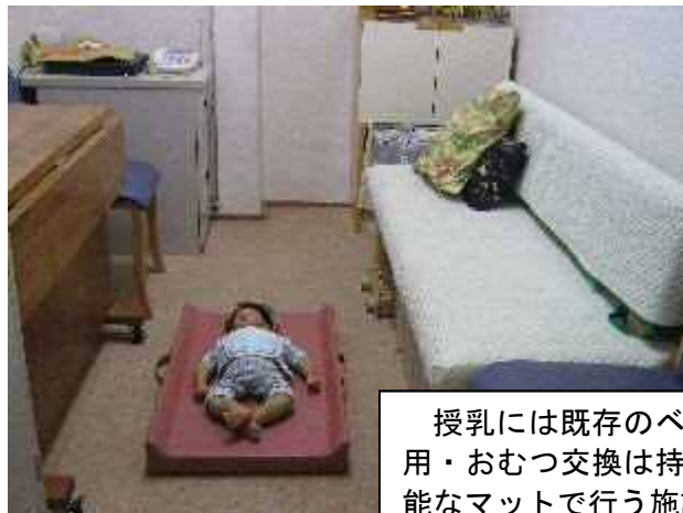
授乳には既存のベンチを利用・おむつ交換は持ち運び可能なマットで行う施設の例