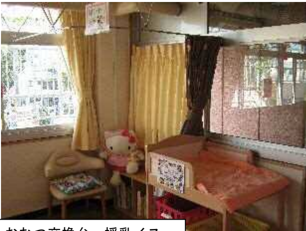
おむつ交換台・授乳イス・カーテンのある施設の例