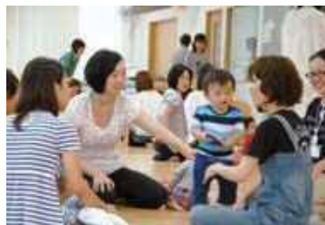
子育てひろばの様子