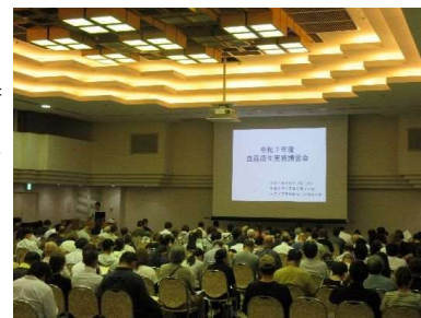
食品衛生大講習会の様子

飲食店（弁当屋）、大量調理施設等の食品衛生責任者*及び広報かつしか・ホームページ等で公募した事業者を対象に、最新の食中毒事例や予防方法について情報を提供します。