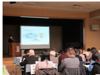
リスクコミュニケーションの様子

毎年度、食品に関するテーマを決めて区民・事業者・行政の三者が会する意見交換会（リスクコミュニケーション）*を開催します。立場の違う者同士が意見交換を行い、食の安全・安心に係る相互理解を深めます。