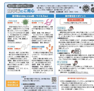
広報かつしかの記事