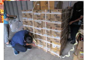
輸入食品の食品監視