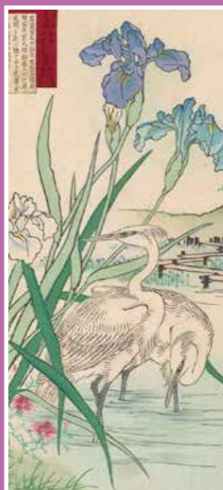
棋額花鳥畫譜 菖蒲・鶯 棋額棋額(豊) 明治16年(1883)