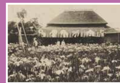
絵葉書 堀切花菖蒲 元祖 観花園 IRIS BLOSSOMS AT HORIKIRI 昭和初期