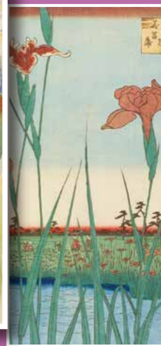
名所江戸百景 堀切の花菖蒲 歌川広重 安政4年(1857)