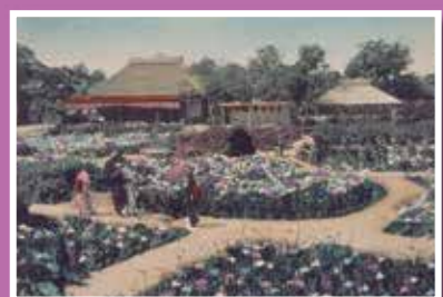
堀切菖蒲園(堀切園) IRIS BLOSSOMS AT HORIKIRI 明治期