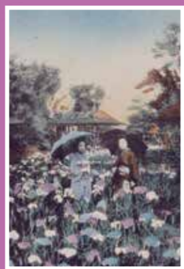
四つ木の花菖蒲 吉野園