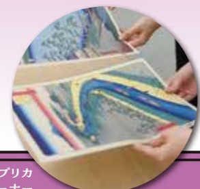
浮世絵のレプリカ さわれる浮世絵のコーナー