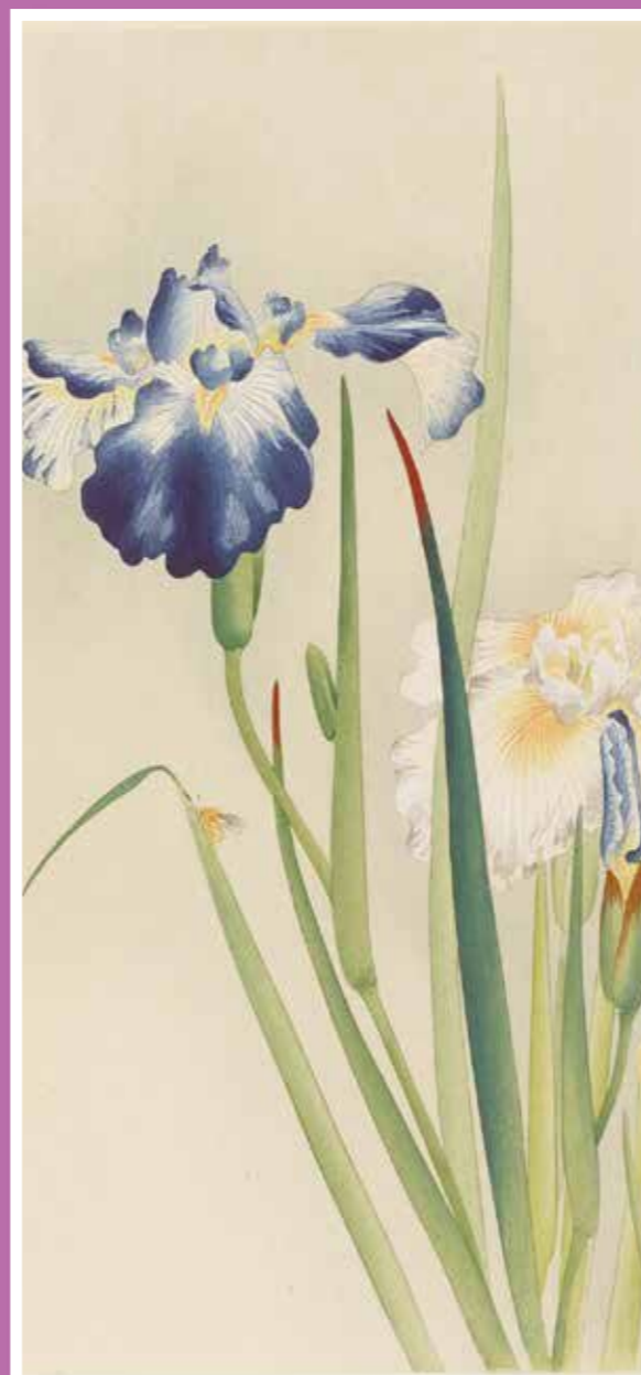
花菖蒲 小原古邨 明治期