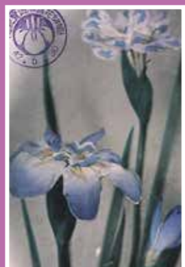
絵葉書 堀切花菖蒲遊覧記念 昭和42年(1967)