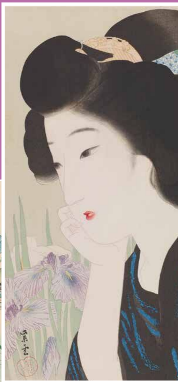
新浮世絵美人合 六月 菖蒲 近藤紫雲 大正13年(1924)