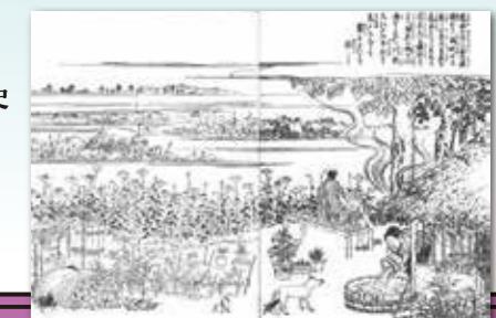
「江戸名所図会」にある花作り

展示品・会期・開催日・開館時間については変更となる場合がありますので、ご来館前に 葛飾区郷土と天文の博物館ウェブサイトでご確認ください。