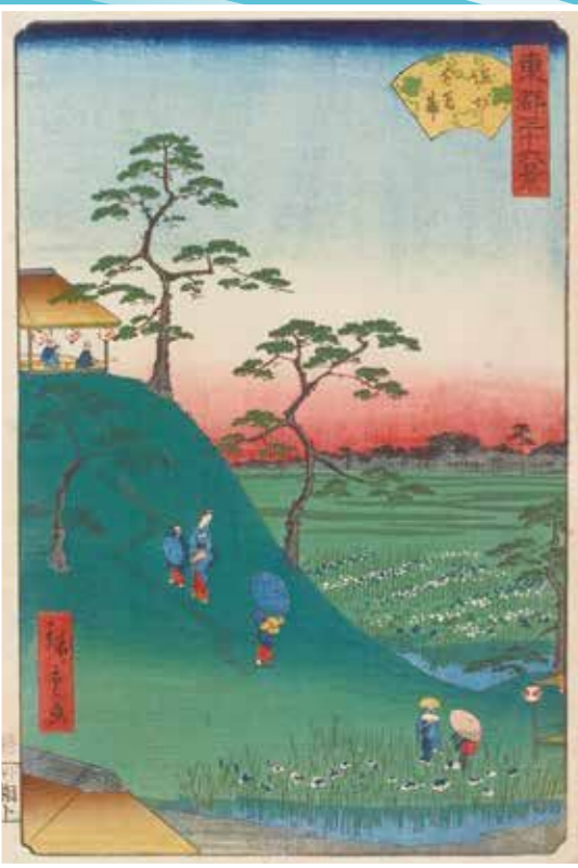
東都三十六景 堀切花菖蒲 二代歌川広重 文久2年(1862)