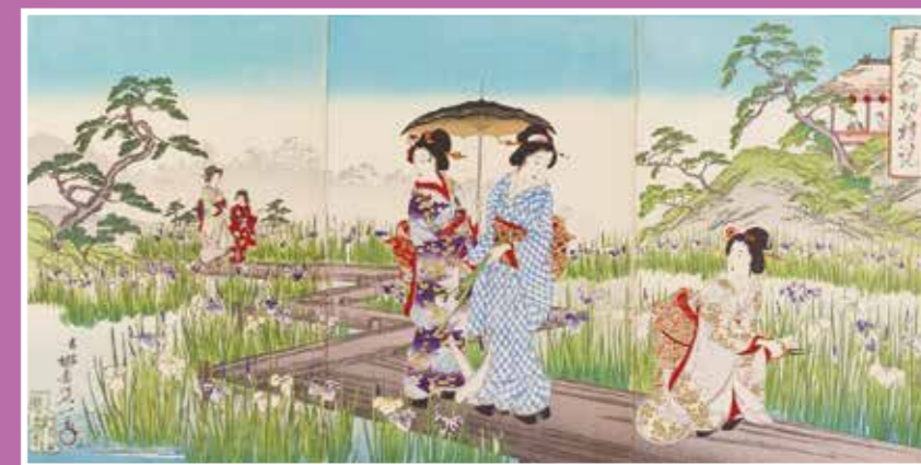
美人堀切の遊覧 楊齋延一 明治27年(1894)