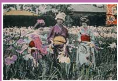
絵葉書 東京堀切ノ菖蒲 Iris Garden, Horikiri, Tokyo 昭和初期