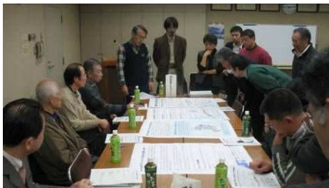
勉強会の話し合いの様子(昨年度)

実際に構想の作成作業を行う「堀切地区まちづくり勉強会」 には、どなたでも参加できますので、ぜひ、ご参加ください!