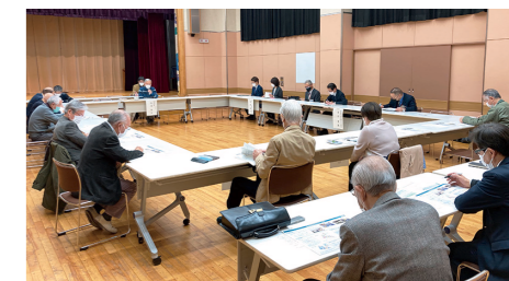
全体会の様子(区職員も含め26名が参加)