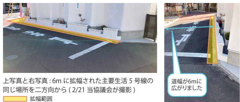
上写真と右写真：6mに拡幅された主要生活5号線の同じ場所を二方向から(2/21 当協議会が撮影) 拡幅範囲

幅員6mへの拡幅路線のうち、主要生活道路5号線は、現在6mへの拡幅整備が進んでいます(下写真参照)。主要生活道路1号線・3号線は、拡幅整備にむけて用地測量の準備を進めており、令和5年度4月頃には、主要生活道路1号線沿線の権利者に向けた事業説明会を予定しています。また、主要生活道路4号線は、無電柱化に向けて引き続き検討調査を進めています。