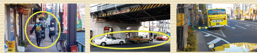
左写真: 狭く歩きにくい歩道。 中央写真: 駅前にタクシー乗り場がない。 右写真: バスが正着できない。