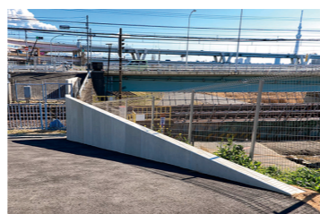
線路脇に設置されたパラペット (2/21)