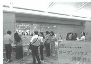
【素案説明を行った際の様子 (新小岩駅北口駅前広場)】

【お問合せ先】 都市整備部都市計画課街づくり計画担当係 ☎03-5654-8382