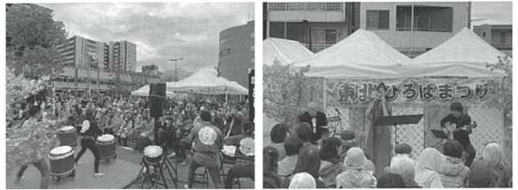
【東北ひろばまつりの様子】

ステージでの演奏やパフォーマンスに加え、体験型防災訓練、モンチッチくん・モンチッチちゃんや駅長犬との記念撮影会のほか、東京聖栄大学の焼きそばやフランクフルト、福島県境町の地場産野菜やポン菓子の出店等もあり、大盛況となりました。