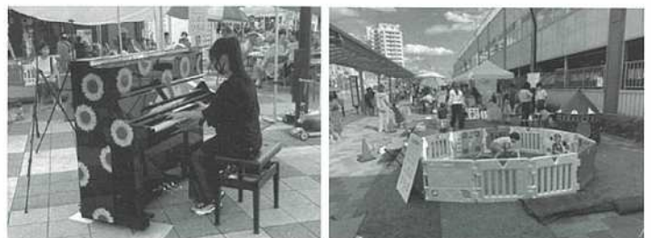
【あそびばプロジェクトの様子】

イベントでは、地元の飲食店や地元町会による飲食出店、親子で遊べるしばふひろばやストリートピアノ、デジタルサイネージの設置など、来場者が楽しめる催しを企画することで計約6,000人が来場し、新小岩北地域を盛り上げました。