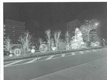
【新小岩駅東北広場】

南地域では、新小岩駅南口駅前広場でのゴールドとピンクのイルミネーションに加え、モンチッチをフォトスポットとして設置し、クリスマスと正月の季節に合わせた飾り替えを行いました。