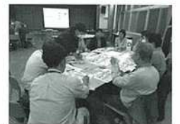
【ワークショップの様子】