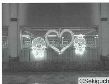
【新小岩東北自転車駐車場壁面】

北地域では、新小岩駅北口駅前、新小岩駅東北広場、スカイデッキつつみ及び私学事業団総合グラウンドにつながる道路をカラフルなイルミネーションで彩るとともに、新たに新小岩東北自転車駐車場壁面にモンチッチオブジェを設置し、フォトスポットとしてお楽しみいただきました。