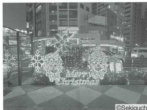
【新小岩駅南口駅前広場】