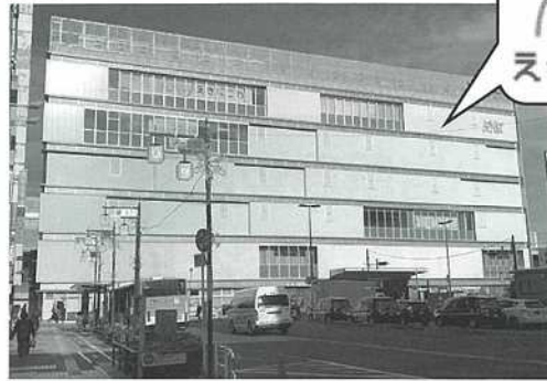
【J R 新小岩南口ビル 外観】