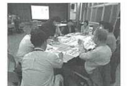
【ワークショップの様子】