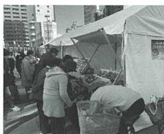
【南口えきひろマルシェ】