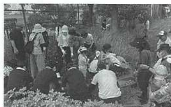
【ジャガイモ堀の様子】