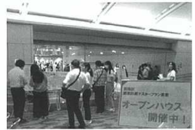
【素案説明を行った際の様子 (新小岩駅北口駅前広場)】