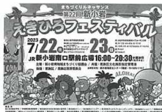
【えきひろフェスティバルポスター】

7月22～23日に第22回新小岩えきひろフェスティバルを開催しました。ハワイアンをテーマに地元フラダンスサークルや新小岩中学校・小松中学校の演奏やパフォーマンス等を披露した他、今回は商店街とコラボしたまちめぐりスタンプラリーを実施し、楽しんで頂きました。