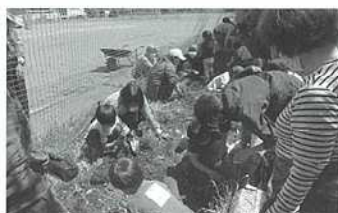
【ラベンダー燭づくり】