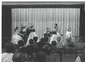
【CLASSICコンサートの様子】

11月10～12日に第22回新小岩文化祭を開催しました。絵画や手芸等、様々なサークルの展示や演芸フェスティバル等を楽しんで頂きました。ふるさと劇場にてCLASSICコンサートや幼児ミュージックベル等の公演を行ったほか、飲食コーナーとしてキッチンカーやカフェ等を出店し、多世代の方に楽しんで頂きました。第23回は令和7年3月に開催予定。