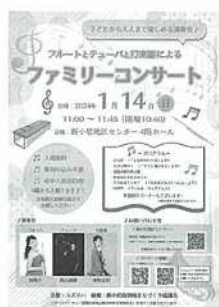
【ファミリーコンサートポスター】