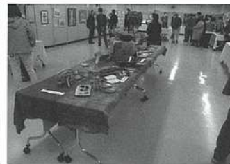
【文化祭展示の様子】