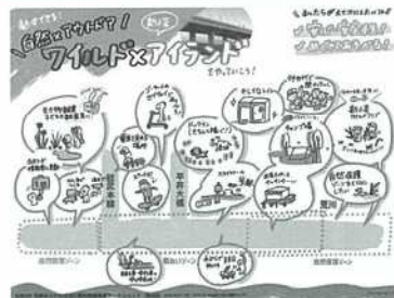
【ワークショップでのアイデア】

令和 3 年度に策定した基本構想をもとに、整備内容の検討を進めています。公園を実際に利活用する視点として、ワークショップにて地域の皆様とともにアイデアを出し合い、またそのアイデアの一部を試してみるイベントを令和 5 年 12 月 16 日に開催しました。イベント当日は天候にも恵まれ、将来の公園の姿の一部が想起されるものとなりました。