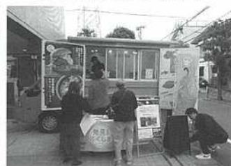
【福島県応援キッチンカーの様子】