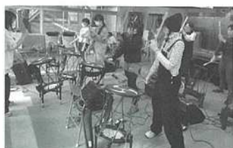
【電子和太鼓教室の様子】