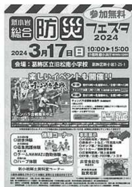
【防災フェスタポスター】