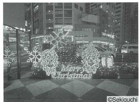
【新小岩駅南口駅前広場】