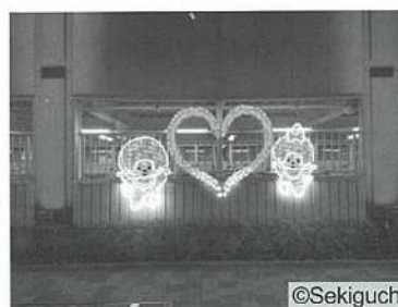
【新小岩東北自転車駐車場壁面】

北地域では、新小岩駅北口駅前、新小岩駅東北広場、スカイデッキたつみ及び私学事業団総合グラウンドにつながる道路をカラフルなイルミネーションで彩るとともに、新たに新小岩東北自転車駐車場壁面にモンチッチオブジェを設置し、フォトスポットとしてお楽しみいただきました。