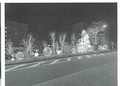
【新小岩駅東北広場】

南地域では、新小岩駅南口駅前広場でのゴールドとピンクのイルミネーションに加え、モンチッチをフォトスポットとして設置し、クリスマスと正月の季節に合わせた飾り替えを行いました。 点灯期間：令和5年12月1日～令和6年2月14日