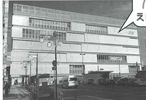
【J R 新小岩南口ビル 外観】