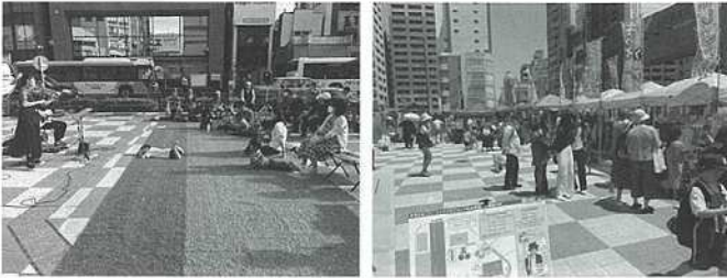
【親子ガーデンの様子】