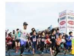
かつしかふれあいRUNフェスタ(3月) ランニング100選にも選ばれた人気大会！