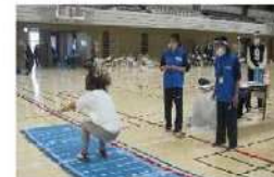
～測って、知ろう！～体カテスト！(5・12月) 大規模実施を年2回行います！