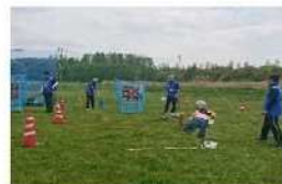
こどもまつり(5月) スポーツ広場を運営します！