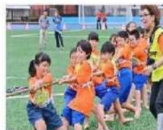
スポーツフェスティバル(10月) 体育の日に実施する区内最大級のイベント