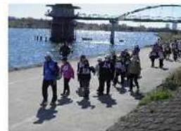
柴又・水元紅葉ウォーキング(11月) スポーツの秋！健康ウォーキング！