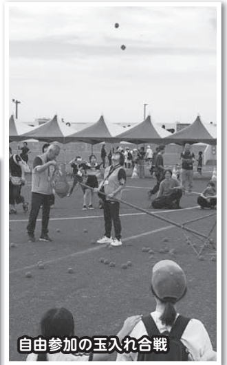
自由参加の玉入れ合戦