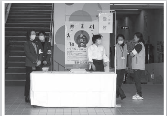
▲受付と誘導の係の様子