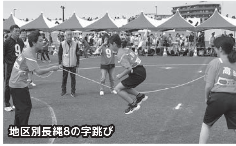
地区別長縄8の字跳び