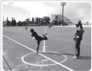
ソフトボール投げ