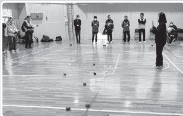
白熱するボッチャ対抗戦

スポーツ推進委員はスポーツやレクリエーション等健康づくりに関する研修や講演会に参加しています。また、年に一回、協議会としてみんなで研修会を行っています。今回、初めての試みとして栃木県日光市のスポーツ推進委員のみなさんと学習&交流会を行いました。