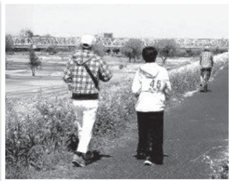
チャレンジコース(10km)