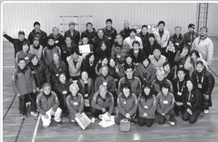
栃木県日光市のスポーツ推進委員のみなさんと