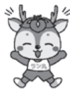
▲大会マスコット「ラン丸」

このイベントは、「かつしかスポーツフェスティバル」と並び葛飾区を代表するスポーツイベントです。全国から多くのランナーが参加するこのような大きな大会の運営に携わることができるのは、スポーツ推進委員として大変やりがいを感じます。来年度も多くの皆様のご参加をお待ちしております。