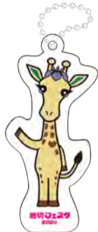
▲ほりきりんキーホルダー