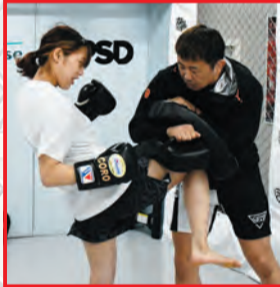
▲CORO選手との練習の様子

両親の勧めで、4歳から柔道、小学4年生からレスリングを始めました。子どもや人に教えることが好きだったため、高校生の時に教員に憧れを持つようになり、卒業後は東京学芸大学に進学し、教員をめざしながら柔道を続けていました。しかし、大学院進学時に新型コロナウイルスの流行で柔道部の活動ができなくなり、新たなチャレンジをしたいと思います。その時にテレビで総合格闘技を見て、この競技なら柔道の経験を生かすことができると思い、始めました。