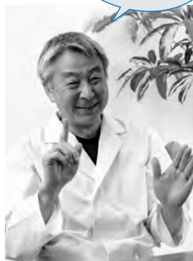
▲作家・明治大学理工学部兼任講師 柳田 理科雄氏