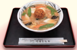
八幡平ポーク使用の 肉みそラーメン