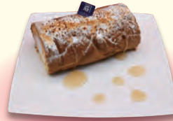
メープルの米米ロール ～国産りんごはちみつがけ～