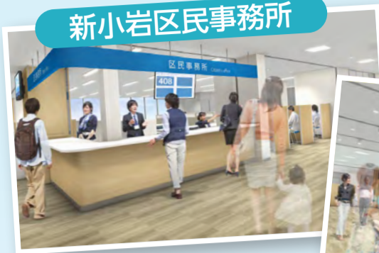
新小岩区民事務所