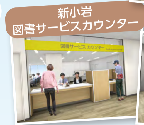
新小岩 図書サービスカウンター