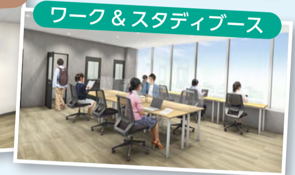
ワーク&スタディブース