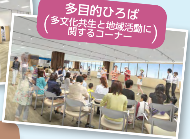
多目的ひろば (多文化共生と地域活動に 関するコーナー)