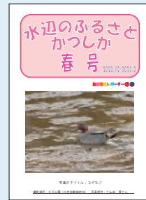
▲自然環境レポーター通信「水辺のふるさとかつしか(春号)」