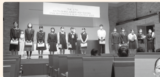
▲各部門の入賞者及び代表者