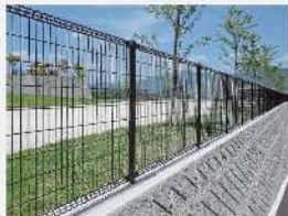
フェンスイメージ