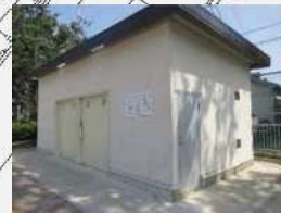
防災倉庫イメージ