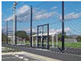
防球ネットイメージ