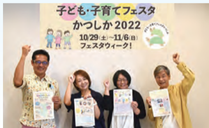
▲実行委員会の皆さん