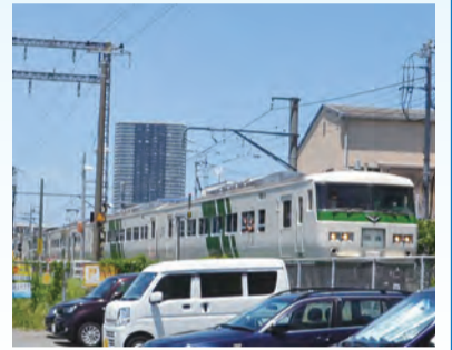
▲新金線を走る貸切列車

これからの新金線を考える会事務局 ☎shinkinsen.since1926@gmail.com