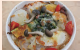
長いも入り彩り野菜の恵みドリア 645円(税込) 写真はイメージです。