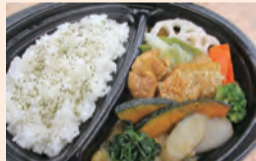
ごろっとチキンと野菜の欲張りスープカレー 753円(税込)

【日程】 11月19日(土)・20日(日)・26日(土)・27日(日) 【会場】 イトーヨーカドーアリオ亀有店 (亀有3-49-3) 購入者にはカレンダー、レシピなどを差し上げます(無くなり次第終了)。