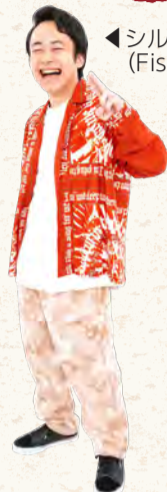
▲シルクロードさん (Fischer's)