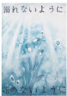
だんむら ゆい か 團村 唯華 (水元中3年)