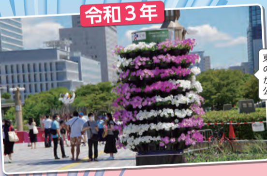
聖火台を彩るフラワーメリーゴーランド

東京2020大会で葛飾生まれのフラワーメリーゴーランドが都立シンボルプロムナード公園に設置されました。