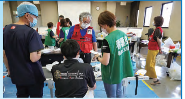
▲災害対策委員会による訓練の様子