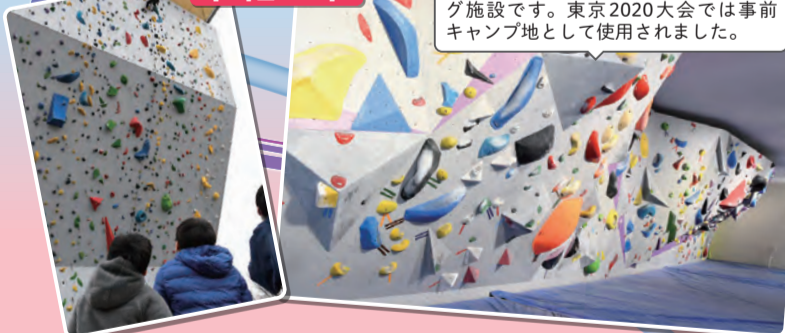
東金町運動場スポーツクライミングセンター完成

東京23区初のスピード・リード・ボルダリングを兼ね備えた総合クライミング施設です。東京2020大会では事前キャンプ地として使用されました。