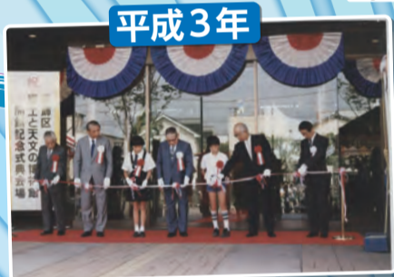
郷土と天文の博物館開館