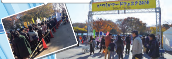
かつしかフードフェスタ初開催