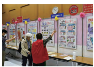
消費者団体のパネル展示