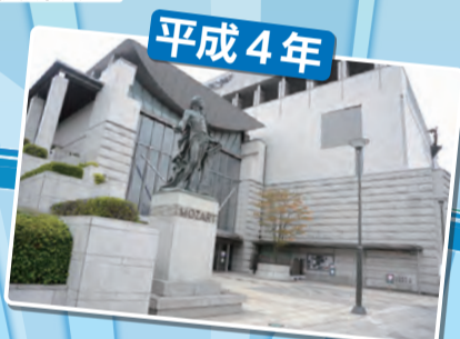
かつしかシンフォニーヒルズ(葛飾区文化会館)開館