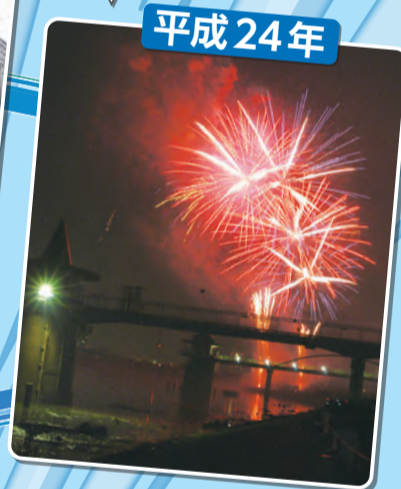
第46回区制施行80周年記念 葛飾納涼花火大会