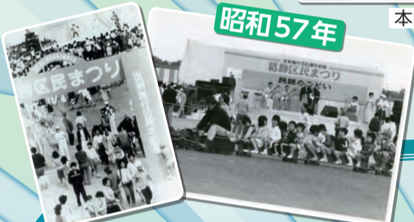
区制施行50周年記念 葛飾区民まつりの様子