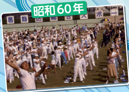
総合スポーツセンター陸上競技場で行われた10,000人の健康体操祭