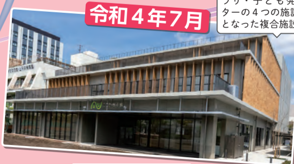
にこわ新小岩開館