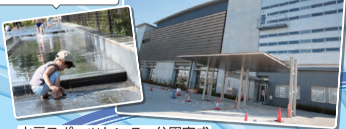
水元スポーツセンター公園完成

毎年11月に新小岩公園にて開催されている、区内の飲食店・食品製造業が一堂に会する葛飾区史上最大のグルメイベントです。