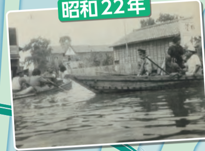
カスリーン台風の洪水被害